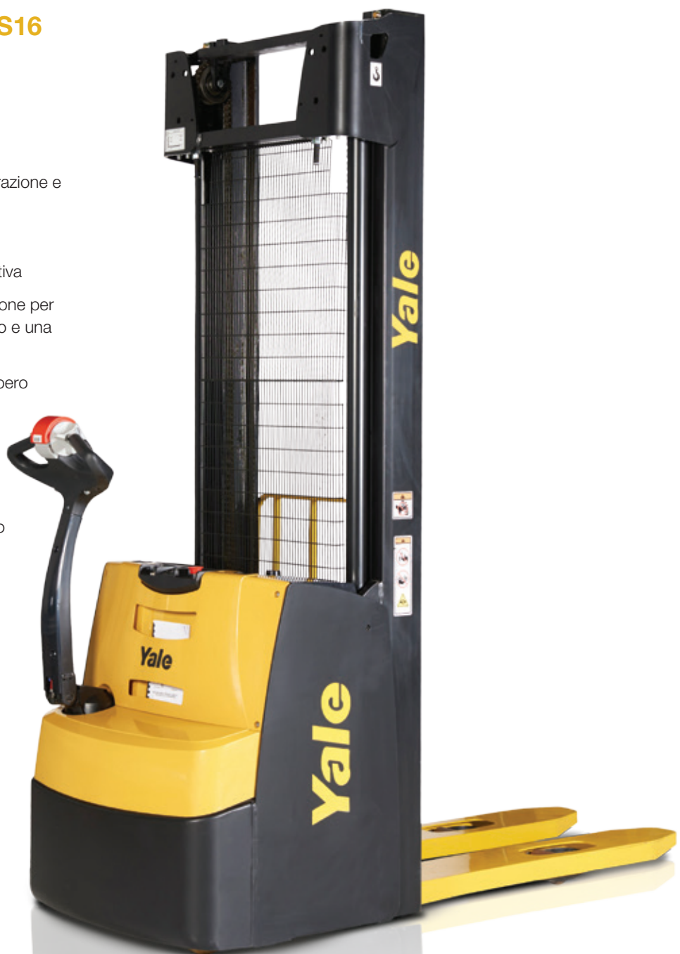
MS10 / MS16