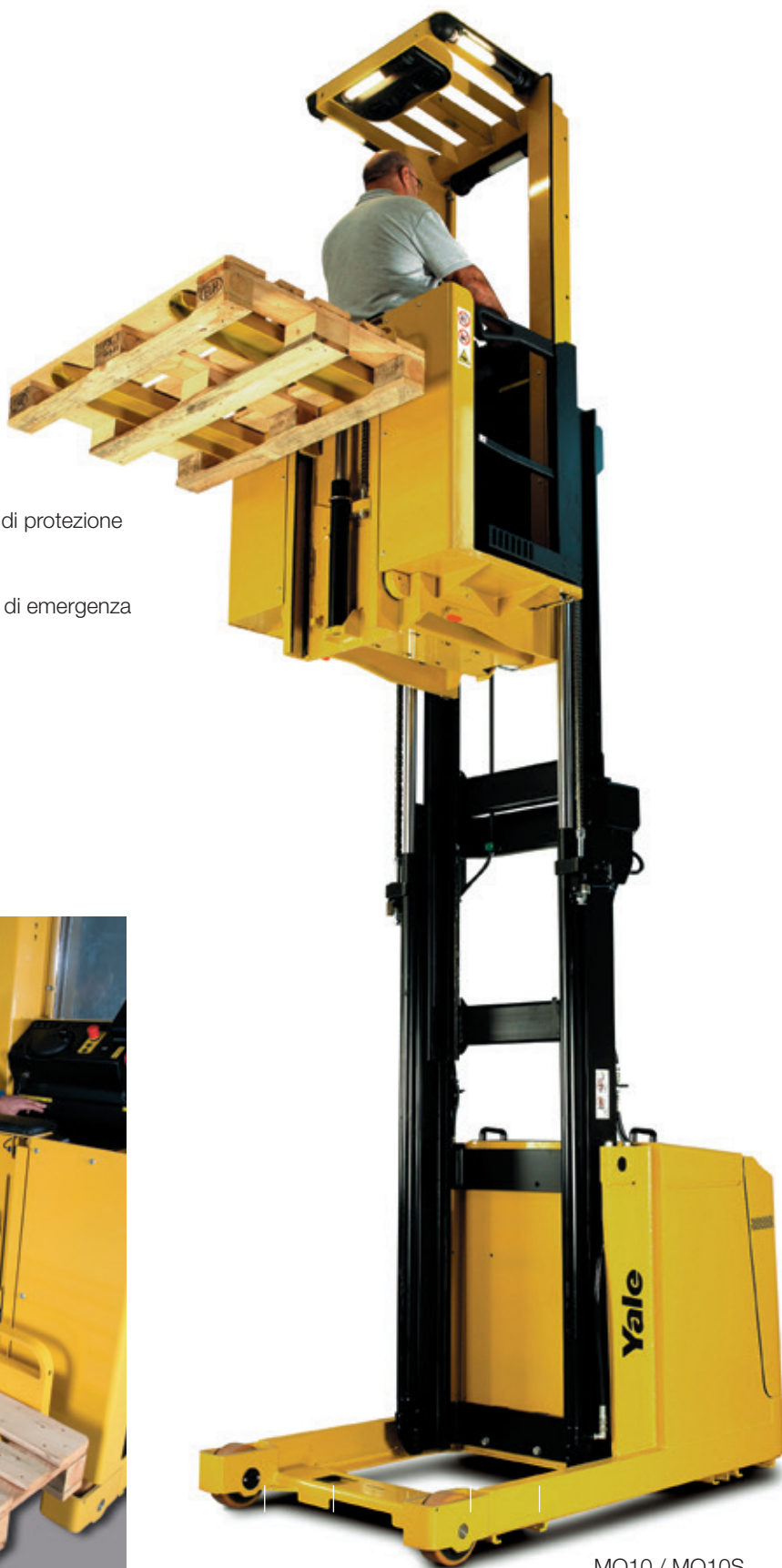
MO10 / MO10S